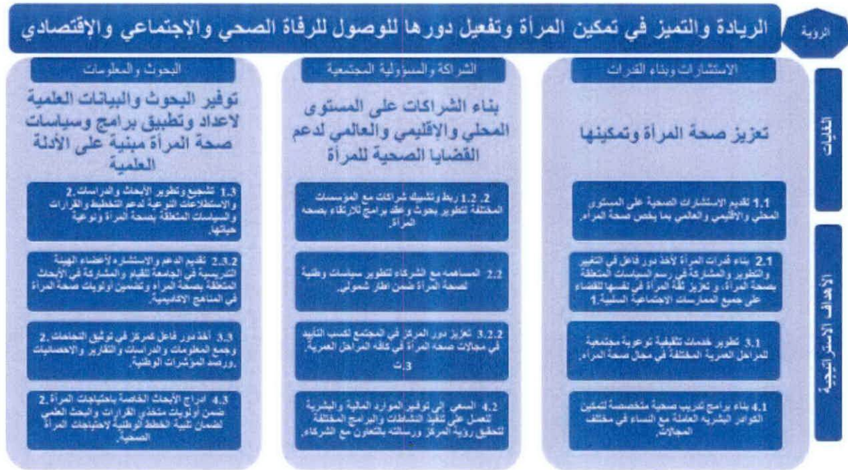
شكل (4): الإطار المنطقي للأهداف الاستراتيجية

ارتكزت الاستراتيجية على تلك المحاور وانبثق عن كل منها توجهات استراتيجية وأهداف محددة، إضافة إلى خطة متابعة وتقييم. كما ينبثق عن هذه الاستراتيجية خطط تنفيذية تحدد النشاطات والبرامج التي سيتم تنفيذها لتحقيق الأهداف المرجوة. ويظهر الإطار المنطقي للأهداف الاستراتيجية في (شكل 4).