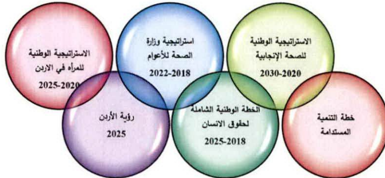
شكل (3): المرجعيات الأساسية للخطة الاستراتيجية لمركز صحة المرأة

استندت الخطة الاستراتيجية على رؤية المملكة الأردنية الهاشمية في مجال الرعاية الصحية والاستراتيجيات الوطنية والدولية كمرتكز أساسي، وأهداف التنمية المستدامة 2030 وبشكل خاص ما هو متعلق بالصحة، وأهداف الاستراتيجية الدولية لصحة الأم والطفل والمراهقات، وكذلك أهداف الخطة الاستراتيجية العربية متعددة القطاعات لصحة الأمهات والأطفال والمراهقات، وأهداف الإطار المفاهيمي الإقليمي لدمج الصحة الإنجابية والجنسية في الرعاية الصحية الأولية، والاستراتيجية الوطنية للمرأة في الأردن 2020-2025 واستراتيجية وزارة الصحة 2018-2022، والاستراتيجية الوطنية للصحة الإنجابية والجنسية 2020-2030 (ملحق 1). كما تم تحليل الخطط الوطنية كخطة التنمية المستدامة والخطة الوطنية الشاملة لحقوق الإنسان 2018-2025 للاطلاع على السياسات والتوجهات العليا اتجاه المرأة، وتحديد الأطر المرجعية لاستراتيجية مركز صحة المرأة (شكل 3).