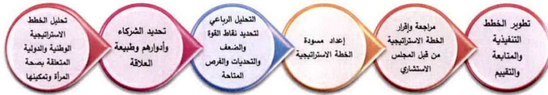
شكل (2): منهجية إعداد الخطة الاستراتيجية

انطلاقاً من رؤية الجامعة المتطلعة لتلبية متطلبات التنمية المستدامة ورؤية المركز الطامحة إلى الريادة والتميز في تمكين المرأة وتفعيل دورها للوصول للرفاه الصحي والاجتماعي والاقتصادي، تم الانطلاق نحو إعداد الخطة الاستراتيجية للمركز. إذ يتبنى المركز أسس النهج التشاركي في إعداد الخطة الاستراتيجية، وتحليل دور الشركاء ومراجعة الخطط الاستراتيجية الوطنية والدولية للوقوف على الواقع والصعوبات والتحديات التي تواجه الصحة من منظور شمولي وانعكاساتها على وضع المرأة الصحي والاجتماعي والاقتصادي، لإعداد برامج ومدخلات محددة تستجيب لتلك التحديات وترتقي بصحة المرأة. تلخصت منهجية إعداد الخطة الاستراتيجية (شكل 2) في المراحل التالية: