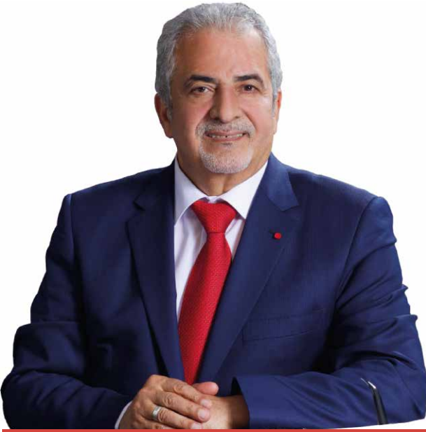
أ. د. ساري حمدان رئيس الجامعة

ندعوكم لزيارة الحرم الجامعي الجميل، ومقابلة طلبتنا وأعضاء الهيئة التدريسية لدينا، والاطلاع على الفرص والأنشطة والتسهيلات المتميزة التي تقدمها جامعة عمّان الأهلية لمجتمعنا وللوطن في ظل القيادة الهاشمية الحكيمة.