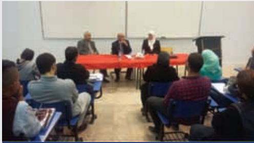
Lecture at Al-Ahliyya Amman University in Al-Karameh Battle Anniversary