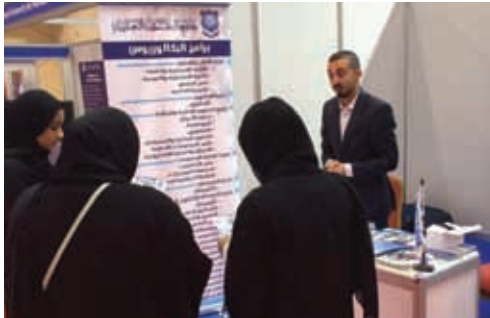
Al-Ahliyya Amman University Participates in the Forum and Exhibition of Arab, International Universities and Educational Institutions in Bahrain